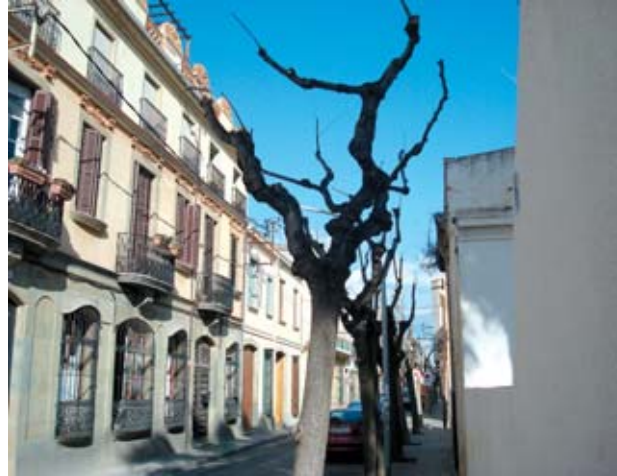
Poda realitzada al carrer Montserrat

El procés de poda, que es va encetar el passat novembre, ha permès eliminar perills per a vianants i trànsit rodat. També s'ha treballat de manera selectiva els arbres que desenvolupen