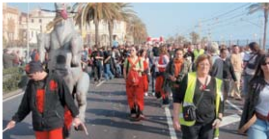
Més de 3.000 persones demanen el trasllat de la via i la gratuïtat de la C-32