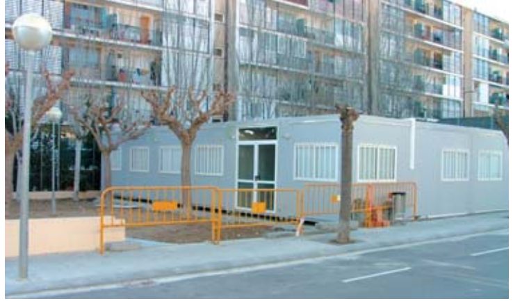
Mòduls de l'escola d'adults situats a la plaça del c/Lluís Guardiola

Amb motiu de les obres al Patronat Parroquial que s'iniciaran properament, i tenint en compte que l'actual seu de l'Escola d'Adults es troba en un dels edificis contigus, s'ha organitzat el trasllat a la que serà, temporalment, la nova ubicació de l'escola. Des de fa uns dies s'han instal·lat un mòduls prefabricats a la plaça del carrer Lluís Guardiola, que serviran per acollir els alumnes que actualment cursen el graduat en educació secundària, cursos preparatius per a la prova d'accés a cicles formatius de grau mitjà, alfabetització i llengua