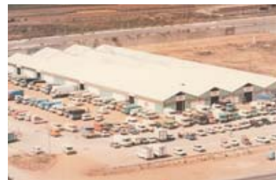
Imatge del Mercat de l'any 1984

jecte, prendre consciència de l'estat real del sector. Cal, però, complementar-ho amb infraestructures de comunicació, serveis a professionals i formació que permeti el millor relleu empresarial i consolidar-nos com a via de comercialització vàlida per als futurs reptes.