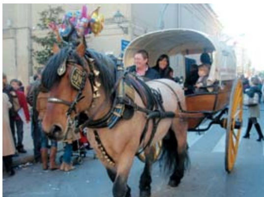
Un dels carros d'enguany