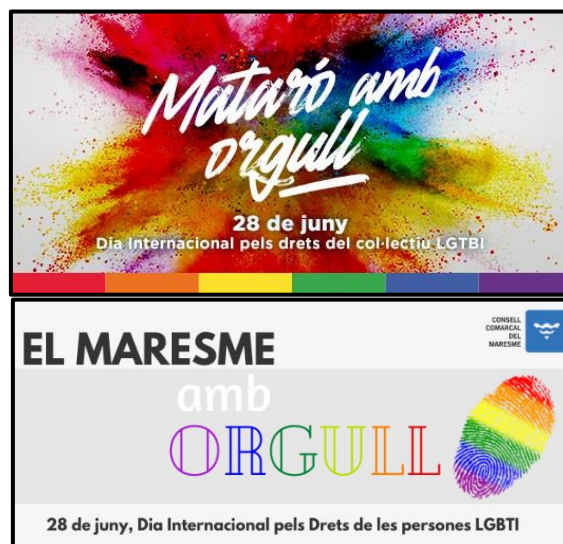
Figura 3: Exemple d'accions realitzades pels ajuntaments de la comarca i el Consell Comarcal per commemorar les diades significatives del col·lectiu LGTBI