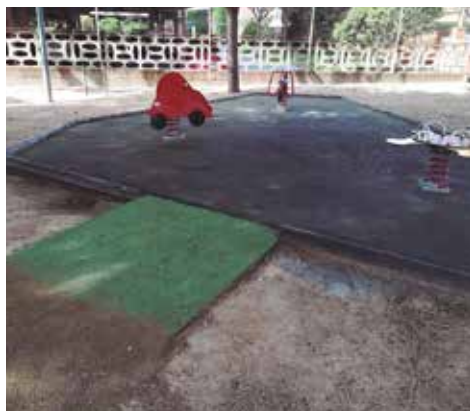
Noves rampes accessibles a Ca l'Abril

a les àrees de joc dels parcs de Ca l'Abril i Joan Monjo. Al parc infantil del Museu de la Marina, per la seva banda, s'ha instal·lat un gronxador inclusiu i s'ha fet accessible l'entrada des de la vorera que fa cantonada amb el Museu.