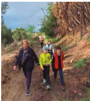
Caminada per la Ruta PIRI