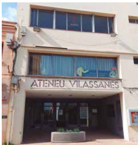
L'edifici de l'Ateneu Vilassanès

El Govern, en previsió de l'elevada inversió de convertir l'Ateneu en un teatre nou, va decidir encarregar el projecte d'un equipament provisional per fer-hi les funcions que acollia l'Ateneu, amb una dotació inicial de 250.000 euros, però el projecte es va encarrir fins als