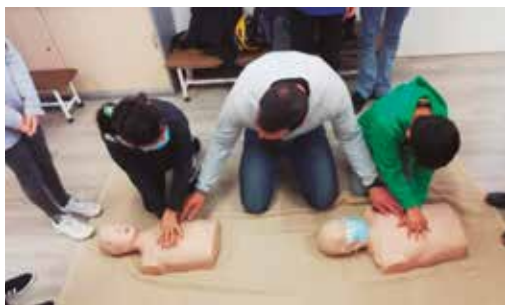
Taller de primers auxilis a l'Escola Pérez Sala