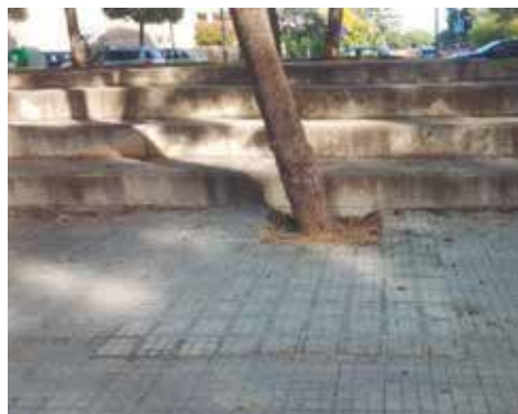
L'abans i el després de les reparacions al passeig Sant Joan de Mar