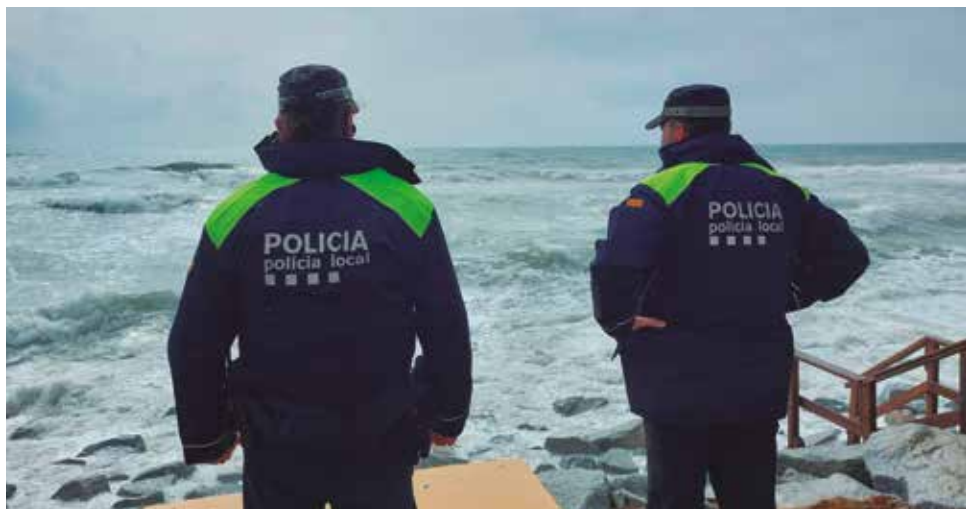
Agents de la Policia Local al passeig Marítim

El passat 18 de març, agents de la Policia local de Vilassar de Mar van aconseguir rescatar del mar una noia de 14 anys, en un dia en què estava vigent l'alerta per temporal marítim i que les onades van arribar als dos metres i mig d'alçada.