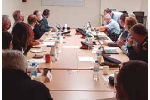
Reunió de la Junta Local de Seguretat

Per volum, amb un 40% del conjunt dels delictes que es van cometre a Vilassar de Mar, els que van tenir més incidència en el municipi són, en primer lloc, els furtus i, en segon lloc, les estafes telemàtiques.