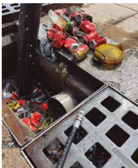
Residus trobats als embornals

res i als contenidors. Això és el que es pretén evitar amb aquestes plaques que, en consonància amb l’objectiu del projecte, l’Ajuntament ha triat en material metàl·lic per la seva durabilitat. Des d’aquestes pàgines, recordem que tenir un poble més net, sostenible i respectuós amb la natura i el mar és una responsabilitat de tothom.