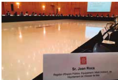
Taula per la qualitat de l'aire de Catalunya

"Afortunadament, nosaltres ja tenim una bona part dels deures fets, ja que es demana un Pla de mobilitat, un Pla de la bicicleta, vies ciclabes per reduir l'ús del vehicle particular, etc. El que sí que és