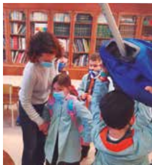
Taller de salut corporal a l'Escola de les Franciscanes