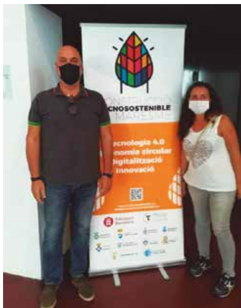
Els regidors de Vilassar de Mar, en la presentació del cicle

Tecnologies 4.0, energies renovables, innovació en els materials i tècniques de construcció, economia circular, digitalització dels processos productius i gestió de residus són alguns dels temes de les videoconferències del cicle, tres de les quals es faran a l'abril i al maig.