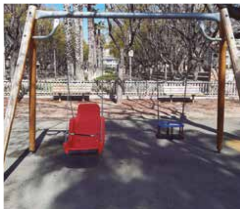
El gronxador inclusiu del parc infantil del Museu de la Marina