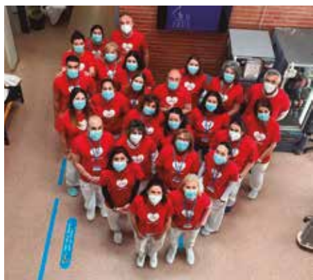
Les i els treballadors del CAP amb la Setmana de la Salut