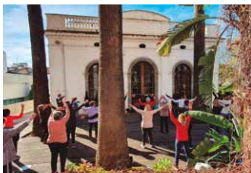
Taller de tixung a Can Bisa