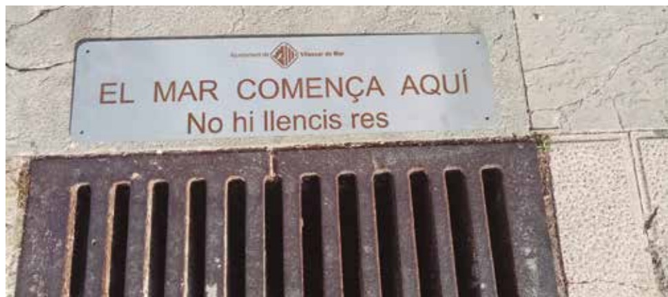
Les noves plaques

“El mar comença aquí. No hi llencis res”. Aquest és el lema de les plaques que, des d’aquest mes d’abril, es poden veure al costat d’embornals de Vilassar de Mar amb l’objectiu de conscienciar la ciutadania sobre el fet que bona part dels residus que aboquem al carrer acaben a les nostres platges i al nostre mar. És el que proposava un dels projectes participatius més votats de 2020 i que ara es fa realitat amb la instal·lació progressiva de 200 plaques metàl·liques a tot el poble. La instal·lació, que ja s’ha començat a fer, prioritzarà els carrers i places de molta afluència, els embornals situats al costat les terrasses de bars i restaurants i aquells que estan a prop de carrers, torrents i rieres que van al mar. També es donarà prioritat als ubicats en passos subterranis i davant d’equipaments municipals, com ara les escoles.