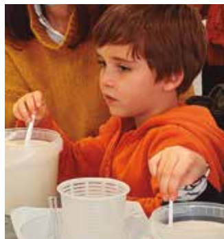
Taller de formatges a Can Bisa