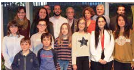
Grup de premiats any 2019

Totes les persones que hi participin estaran agrupades segons l'edat i en tots els grups hi haurà les modalitats de prosa i poesia. En el grup A, les persones amb edats entre 6 i 8 anys, en el grup B les de 9 a 11 anys, i en el grup C les de 12 a 14 anys. En aquests tres grups el premi serà un val a bescanviar per llibres. En el grup D s'hi donaran cabuda a les persones d'entre 15 i 18 anys i el premi serà de 200 €; en el grup E, de 19 a 25 anys, el premi serà de 300 €, i en el grup F, de 26 anys en endavant, de 400 €. Els treballs hauran de ser individuals, escrits en català i inèdits. El