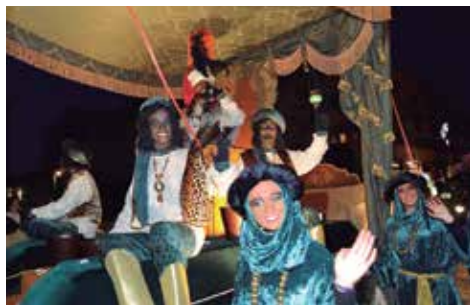
Carrossa de Baltasar