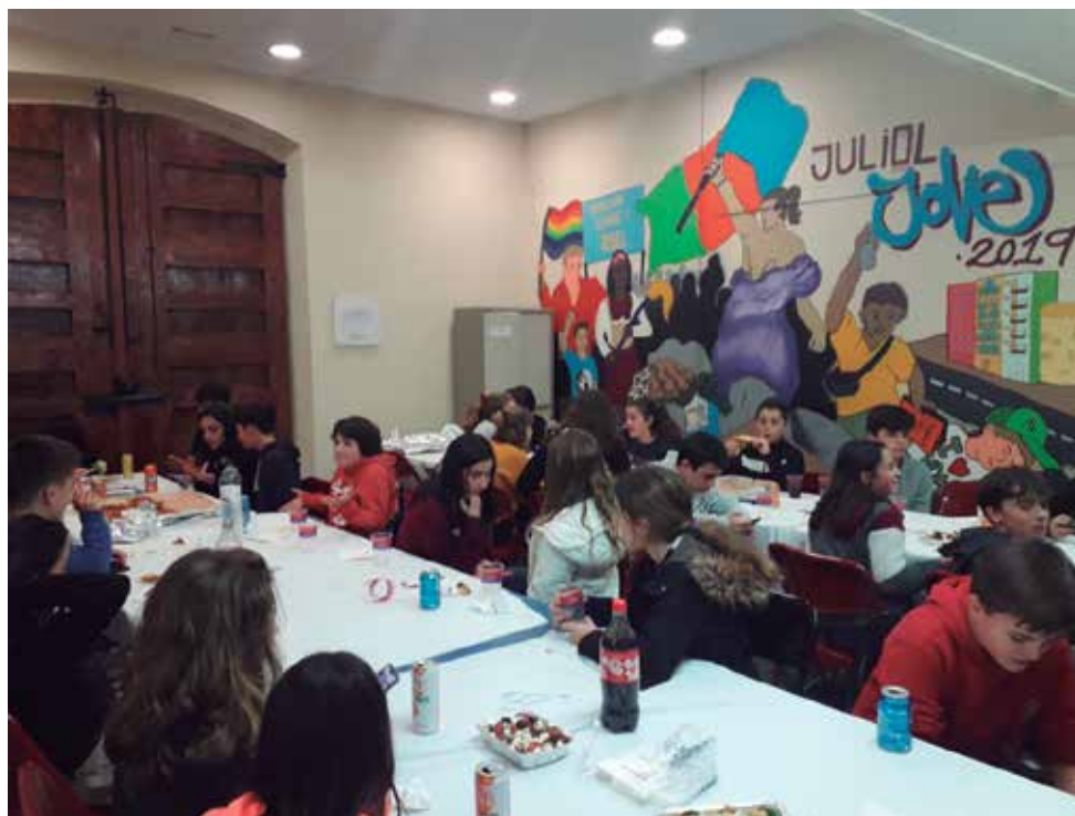
Trobada de desembre

L'objectiu del grup motor és establir les bases del Consell d'Adolescents de Vilassar de Mar i treballar per fer propostes pel municipi. Per a la realització de les propostes es basen en l'Agenda 2030 de Desenvolupament Sostenible de les Nacions Unides. A la primera sessió, els participants van decidir centrar-se en els següents objectius: la igualtat entre els gèneres i apoderament de totes les dones i les nenes; combatre el canvi climàtic i els seus efectes i la promoció de l'ús sostenible dels ecosistemes; l'educació inclusiva i de qualitat per a tothom; i posar fi a la pobresa en totes les seves formes. La pròxima trobada es celebrarà el dimecres 29 de gener, a Can Jorba.