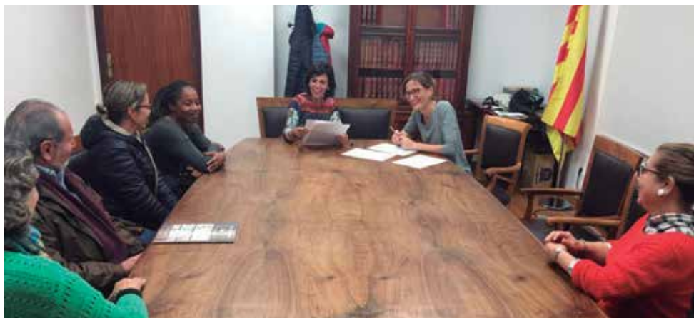
Acte de lliurament dels Certificats de primera Acollida

L'atenció personalitzada es realitza cada dilluns, de 10 a 14 h, a l'Escola Nàutica (c. Santa Eulàlia, 40) i és necessari concertar cita prèvia trucant al 937540500.