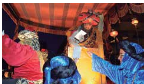
Carrossa de Gaspar

El 28 de desembre, el Carter Reial es va avançar a la comitiva dels Reis d'Orient per recollir les cartes dels infants