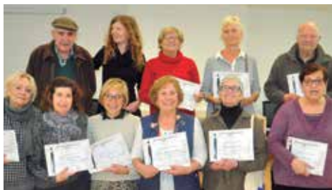
Cloenda curs d'anglès

quotidianes o de viatges. En el segon, les 15 persones participants, han entrenat la memòria mitjançant exercicis pràctics. Aquest darrer curs, per primera vegada, s'ha realitzat al local del Pla de Desenvolupament Comunitari (PDC) del barri del Barato.