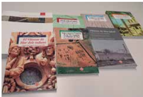
Treballs de la beca Lluch publicats fins ara

L'Ajuntament ha convocat la novena edició de la beca d'investigació i recerca local Ernest Lluch. La beca, de caràcter biennal, dotada amb 4.000 €, té l'objectiu de fomentar la investigació sobre Vilassar de Mar i el seu entorn en tots els seus àmbits, principalment en l'aspecte de la història i de la geografia, i del patrimoni cultural i artístic. Les sol·licituds es poden presentar fins al 18 d'octubre de 2020 al registre general de l'Ajuntament adjuntant, entre d'altres documents, el currículum del sol·licitant i la memòria del projecte d'investigació en la qual s'ha de fer constar els objectius que es volen assolir, la metodologia que s'utilitzarà i les fonts i la bibliografia que es consultarà. El veredictes farà públic