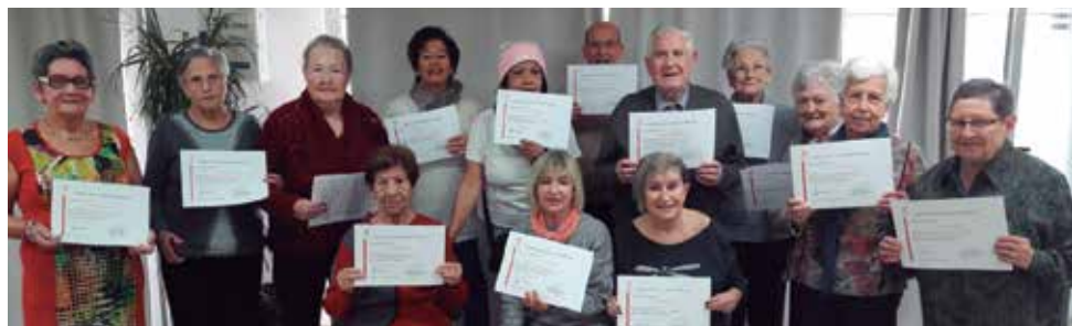
Cloenda taller de la memòria