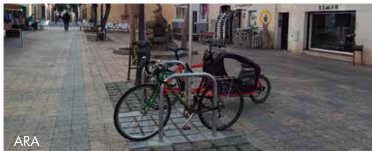
Millores en els aparcaments de bicicletes a la pl. Àngel Guimerà