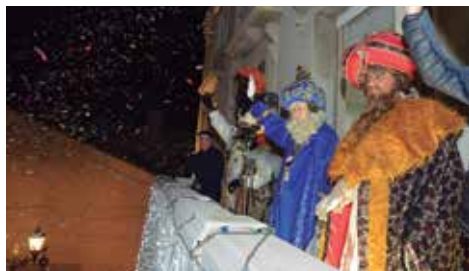
Els Reis d'Orient, des del balcó de l'Ajuntament