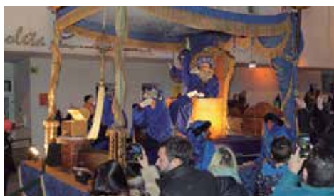
Carrossa de Melchior