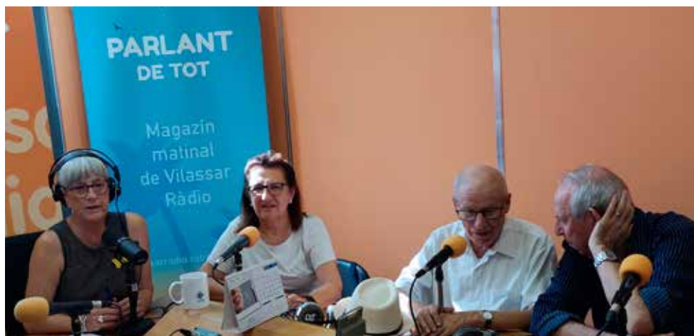
Conductora i tertulians de la secció "Els nostres avis" de Vilassar Ràdio

El 12 de setembre va començar la nova temporada de Vilassar Ràdio marcada per la celebració del 40è aniversari de l'emissora municipal, la segona més antiga de Catalunya. L'informatiu Crònica i els esports locals del nostre municipi són el pal de paller d'una graella on els programes que porten a terme els col·laboradors/es segueixen sent imprescindibles. En aquesta temporada s'estrenen indicatius nous i s'ha renovat el fil musical.