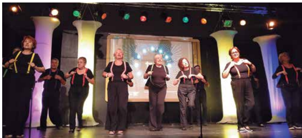
Un dels moments del festival del taller Això serà cosir i cantar