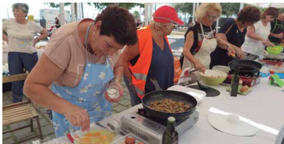
El concurs de truites cada any guanya en participació

Arriba un any més, i ja en són vint-i-un, la Setmana de la Gent Gran, el tradicional homenatge a les persones més grans del poble i ho fa amb moltes activitats pensades perquè es puguin trobar, xerrar i passar una estona tots plegats. A la programació no hi falten les festes i portes obertes a diferents residències de gent gran i centres cívics, el festival de fi de curs del taller Això serà cosir i cantar –on l'alumnat mostra les seves habilitats amb cançons en directe, playbacks, poesia,